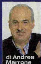
di Andrea Marrone

In libreria Per sfondare nel canto, un'orfana deve ricorrere a un trucco